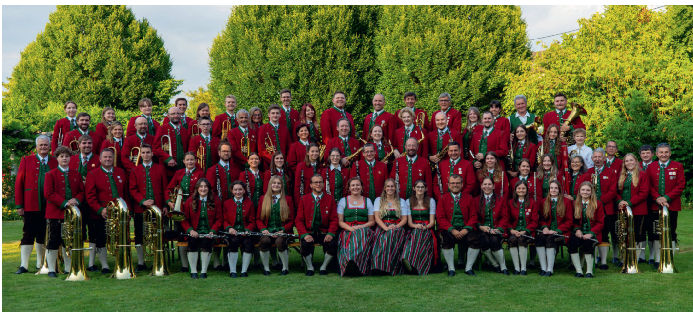
2025: Höchster Frauenanteil bisher mit 34 Musikerinnen und 6 Marketenderinnen. Am Bild sind 3 Marketenderinnen und 29 Musikerinnen.