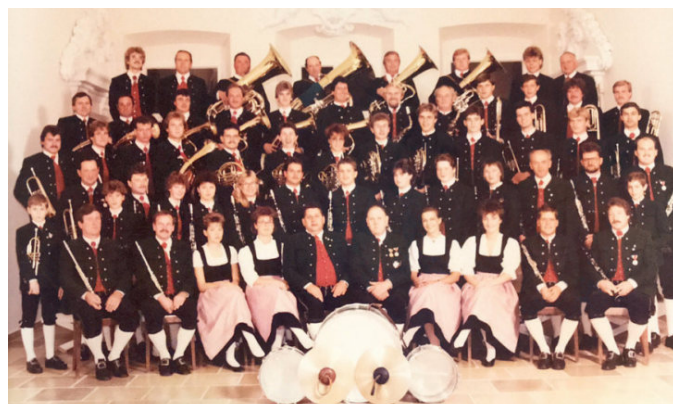
1987: Am Bild sind 7 Musikerinnen und 4 Marketenderinnen.