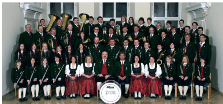
2008: Die 1. Reihe ist weiblich, bis auf Kapellmeister und Obmann! Damals waren 18 Musikerinnen und 4 Marketenderinnen Mitglieder des Musikvereins.